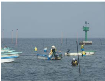
機能低下を招く生物の除去(腹足類)。(H26年度はツメタガイ及びその卵塊を約170kg除去)