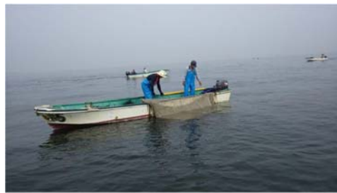
機能低下を招く生物の除去(節足類)(曳網によるウミグモ除去)