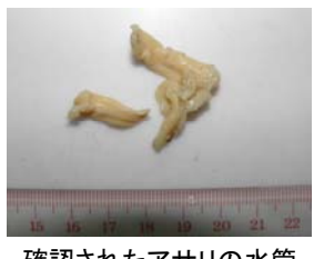
確認されたアサリの水管

除去したエイ類やサメ類の胃内容物を確認した結果、アサリやシロミルの水管が確認されました。アカエイやサメ類は、二枚貝類を主食にしていると言われていましたが、必ずしもそうではなく、時としてアサリやシロミル等の有用二枚貝類もかなり捕食することが確認されました。