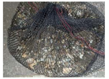
機能低下を招く生物の除去(その他)。(H26年度は潜水によりホトトギスを5540kg除去)