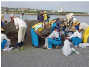
客土(H26年度は約56m 3 を投入)