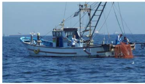
機能低下を招く生物の除去(魚類)。(H26年度は底曳網により、エイ類、サメ類を除去)