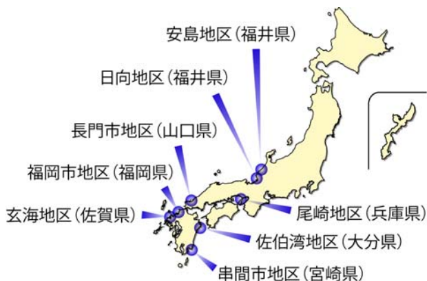
なぎさの守人が保全活動を行う場所

第3回なぎさの守人シンポジウム大阪大会が、12月10日に海遊館で開催された。大阪大会では、なぎさの保全活動を行う8つのグループの代表から、藻場や浅場等の保全活動について、事例発表とディスカッションが行われた。各発表の概要を、以下に紹介したい。