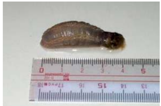
謎のおおい奇妙な生き物”ゴミ”

福岡県福岡市に面す博多湾の浅場では、ナマコの仲間であるゴミが大量発生している。ゴミの環境への影響は不明であるが、底びき網などの曳網（えいもう）・揚網（ようもう）ができない、漁獲物が傷む・窒息死するなど漁業への被害は深刻化している。ゴミは、初