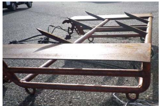
試行錯誤で考案した“桁型耕うん機”

兵庫県の淡路島にある尾崎地区は、昭和40年代までは遠浅で砂の粒が粗い浅場が広がっていた。しかし、近年、河岸や海岸のコンクリート化によって山・川・海のつながりが失われ、陸域からの砂の供給量が減り、その結果、小さい粒がそろった硬く締まった底質へと浅場環境が変化した。また、それに伴って、浅場を利用するアサリやカレイなどの魚介類も激減した。そこで、底質環境を改善