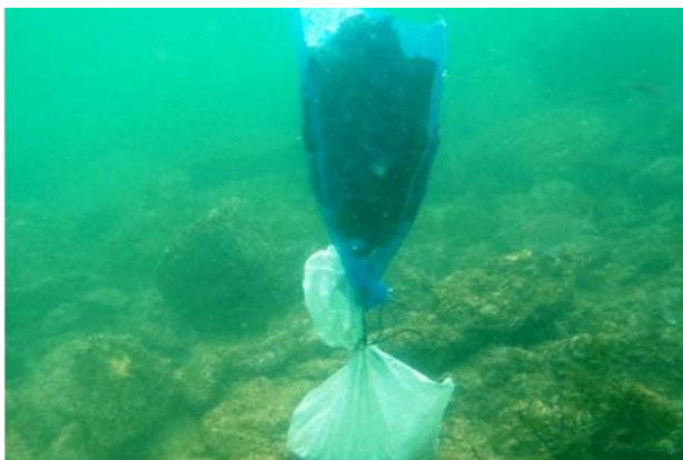
種をつけた母藻をネットに入れて海底に設置。この方法は、スポアバック法と呼ばれている。

大分県の南部に位置する佐伯湾では、15年ほど前からクロメという海藻が繁茂する藻場が衰退し、海の砂漠化と呼ばれる「磯焼け」が起きている。その原因はさまざま考えられるが、アイゴやブダイなどの魚類やウニによる食害が藻場の再生を妨げる要因となっている。そこで、藻場の恵みを採って暮らす海士（あま（男の潜水漁師））によって藻場保全区域のウニを除去し、そこに種をつけたクロメの母藻を設置する取組を行っている。また、一部の保全区域にはウニフェンス（前述のウニハードルに類似）を設置する取組も行っている。現在、このウニフェンスを設置した区域では、クロメの着生、そして生長が確認さ