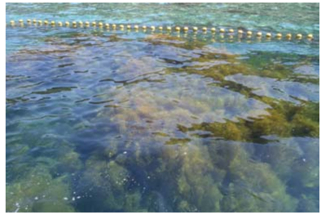
囲い網の中の海は、海藻のジャングル！

にとって念願であることから、平成 13 年から保全活動をスタート。保全活動を進めるうちに、海藻を食べるイスズミなどの魚類やウニが藻場の再生を阻害していることが判明。そこで、現在は、魚類の侵入を防ぐ囲い網を藻場再生区域に張り、更に囲い網の中にウニの侵入を防ぐウニハードルを設置。その中のウニを徹底的に除去し、種をつけたホンダワラ類の母藻を設置する取組を行っている。狭いエリアではあるが、取組を行った場所では、毎年、ホンダワラ類が海面まで生い茂っており、種を周辺の海域に飛ばしている。