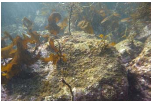
ガンガゼを除去した区域にアラメが生えてきた！

佐賀県唐津市にある玄海地区には、藻場でアワビやサザエ、ウニを採って暮らす海士がいる。藻場を見続ける海士は、10年ほど前から藻場の衰退を実感している。藻場の衰退は、以前はあまり目にしなかったガンガゼというウニの増加が原因の一つと考えられている。