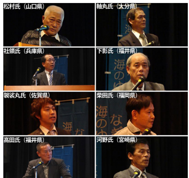
8人の”なぎさの守人”