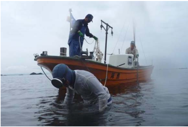
手作業で砂に埋もれた石や岩を元に戻す”岩おこし”

石が砂に埋もれてしまったことが大きな原因と考えられる。そこで、砂に埋もれた石や岩をめぐって、砂の上にもどす”岩おこし”の活動を行っている。作業は、海女や浅海（せんかい）漁師が海に入って一つ一つ手作業で石や岩をめくるやり方と、場所によってはパワーショベルを使って岩をめくるやり方の二つの方法で行われている。苦労の絶えない取組であるが、今年の10月に岩おこしをした場所に海藻の着生が認められるようになった。また、昨年度は全くいなかった磯ダコが再び生息するようになってきている。