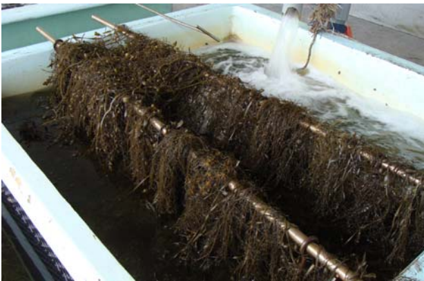
<用意された母藻（ヨレモクモドキ）>

当日は児童の皆さんが、スポアバッグに魚や海藻など思い思いの絵を描き、母藻（ヨレモクモドキ）を取り付けました。