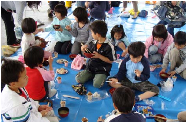
＜地先の海の幸をおいしくいただきました＞

2 日目のお昼には、漁協女性部の皆さんの手作りによる、地先の海の幸を用いた料理が振る舞われました。ハバ（海藻：ヒロメ）入りドーナツ、藻場を食害するガンガゼを有効活用したウニバターのカナッペ（ガンガゼにマーガリンを和えたもの）、そして、魚類養殖が盛んな佐伯市ならではのヒラマサ、カンパチのお寿司など、児童の皆さんは大喜びの様子でした。