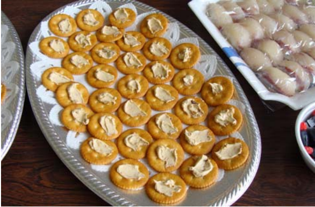
＜ウニ（ガンガゼ）バターのカナッペ＞

2 日目のお昼には、漁協女性部の皆さんの手作りによる、地先の海の幸を用いた料理が振る舞われました。ハバ（海藻：ヒロメ）入りドーナツ、藻場を食害するガンガゼを有効活用したウニバターのカナッペ（ガンガゼにマーガリンを和えたもの）、そして、魚類養殖が盛んな佐伯市ならではのヒラマサ、カンパチのお寿司など、児童の皆さんは大喜びの様子でした。