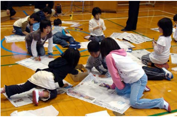
<スポアバッグに思い思いの絵を描きました>

当日は児童の皆さんが、スポアバッグに魚や海藻など思い思いの絵を描き、母藻（ヨレモクモドキ）を取り付けました。