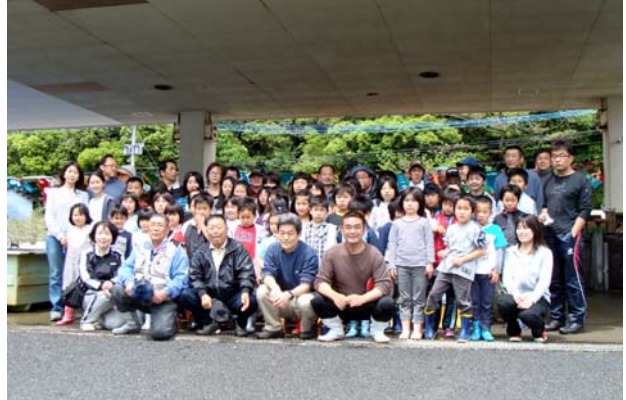
＜次の開催を誓い記念撮影＞