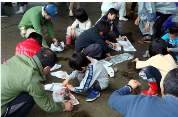
<スポアバッグに母藻を取り付けました>

あいにくの天気と波浪で、児童の皆さんによる海中への投入はできませんでしたが、感想を聞くと、「楽しい！」と元気のいい返事が返ってきました。「藻が動いとる！」と、藻に擬態してくっついていくたくさんのワレカラ