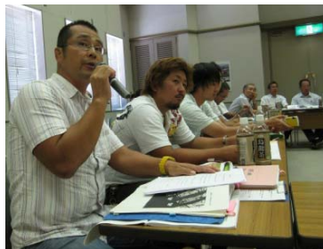
参加者による各地域の活動状況の発表と意見交換会