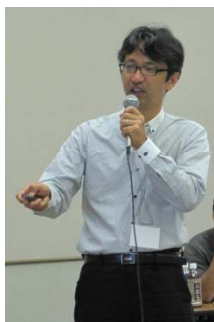
干潟・浅場域の生産力向上のためのモニタリング・保全活動のポイント