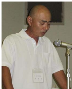
「今一色干潟保全会」の活動内容の紹介