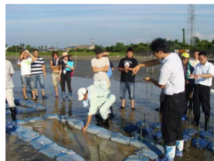
新技術「ケアシェル」を視察