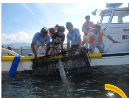
海底耕うん作業の視察