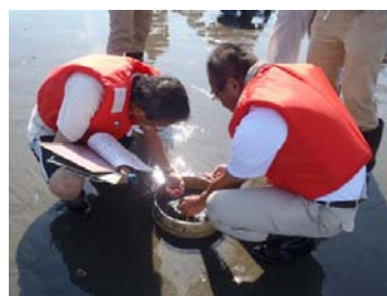
方形枠とふるいを使った生物採取実習