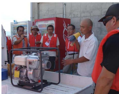
地元の活動組織の方に、使用している機器等について説明して頂きながら実習を行いました