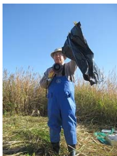
産卵状況調査キットの作成と設置方法 について専門家から教えていただき、 実際に作りました