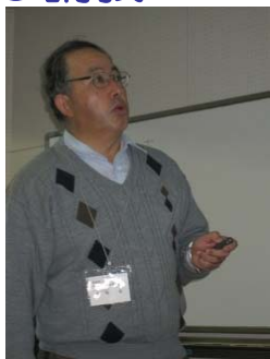
「ヨシ帯における産卵場・「GPSを用いた面積 幼稚仔魚調査等の紹介」 について