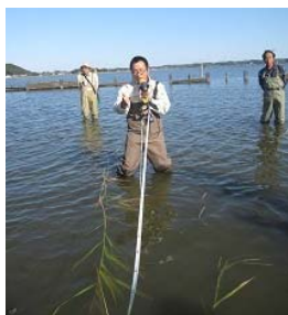
水際ヨシ帯の伸長状況の観察方法