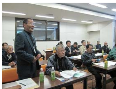
参加者による各地域の 活動状況の発表と意見交換会