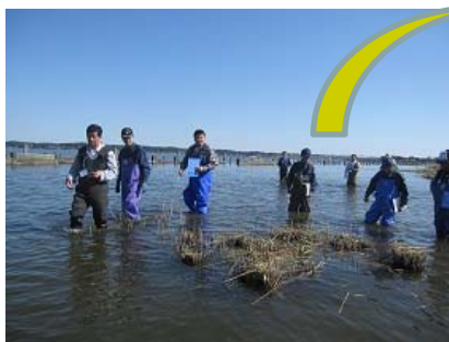
携帯型GPSを使った測定方法