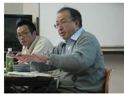
専門家からの活動内容に 沿った具体的なアドバイス