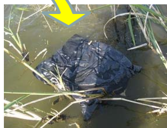
設置した産卵状況調査キット