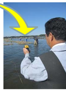
実際にGPSを操作しながら行いました