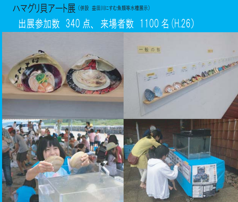
ハマグリ貝アート展 (併設 益田川にすむ魚類等水槽展示) 出展参加数 340点、来場者数 1100名 (H.26)