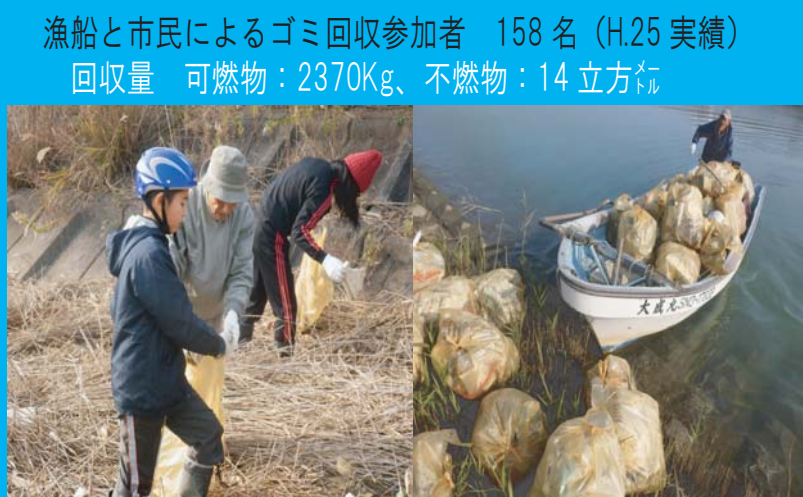
漁船と市民によるゴミ回収参加者 158名 (H.25実績) 回収量 可燃物：2370Kg、不燃物：14立方メートル

④教育と啓発の場の提供 ハマグリ生態に関する環境教育、益田川の魚貝類水槽展示、ハマグリ貝アート展開催等